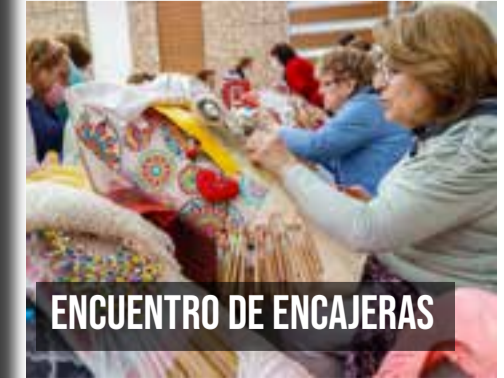
ENCUENTRO DE ENCAJERAS