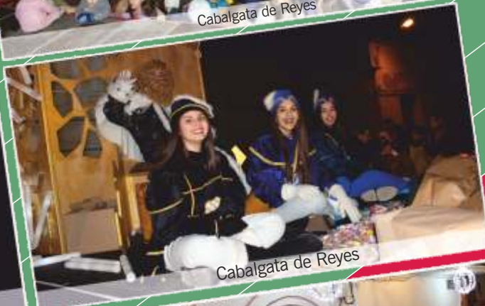
Cabalgata de Reyes