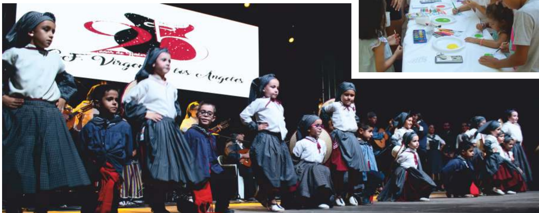
FIESTA DE LA VENDIMIA ORGANIZADA POR EL GRUPO FOLKLÓRICO VIRGEN DE LOS ÁNGELES