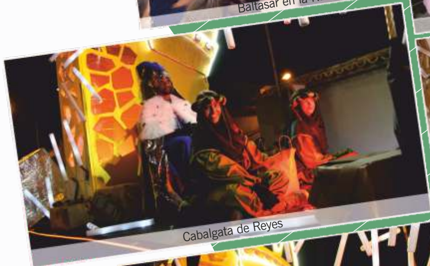
Cabalgata de Reyes