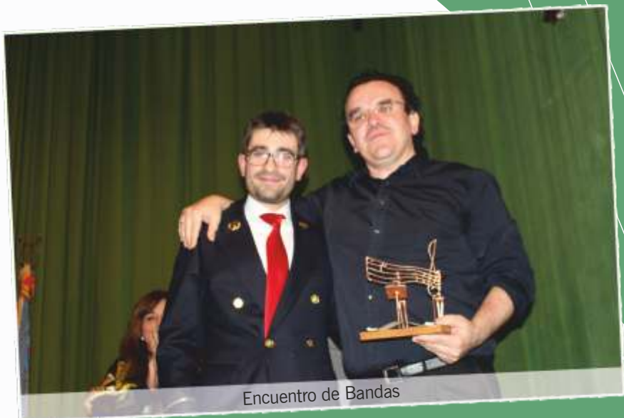
Encuentro de Bandas