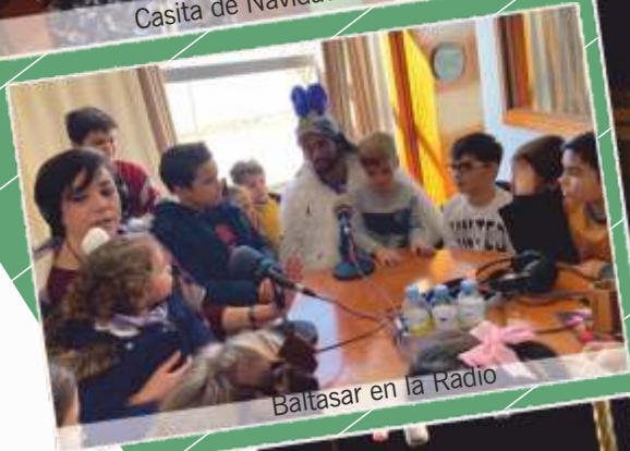
Baltasar en la Radio