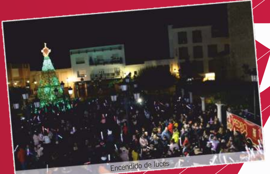
Encendido de luces