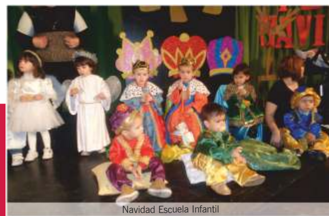
Navidad Escuela Infantil