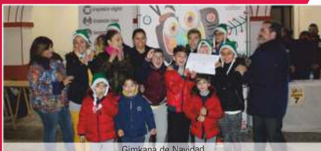
Gimkana de Navidad