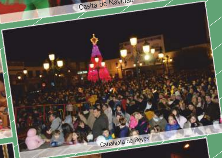
Cabalgata de Reyes