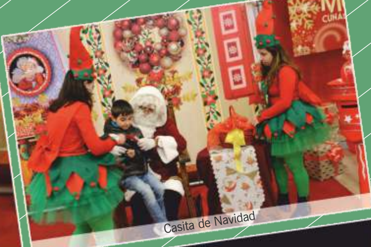
Casita de Navidad