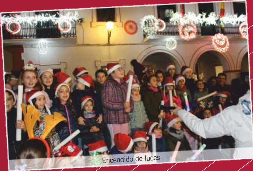
Encendido de luces