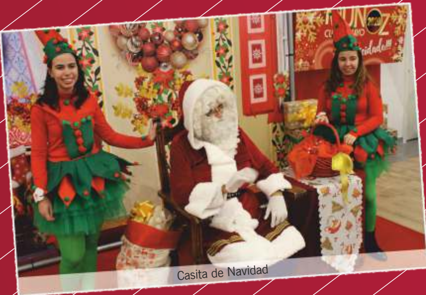
Casita de Navidad