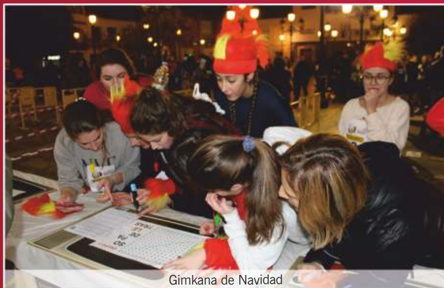
Gimkana de Navidad

En definitiva, hemos vivido unas Navidades en las que la participación y la colaboración de todos y todas ha permitido que la ilusión y la magia llegue, un año más, a todos los rincones de Pedro Muñoz.