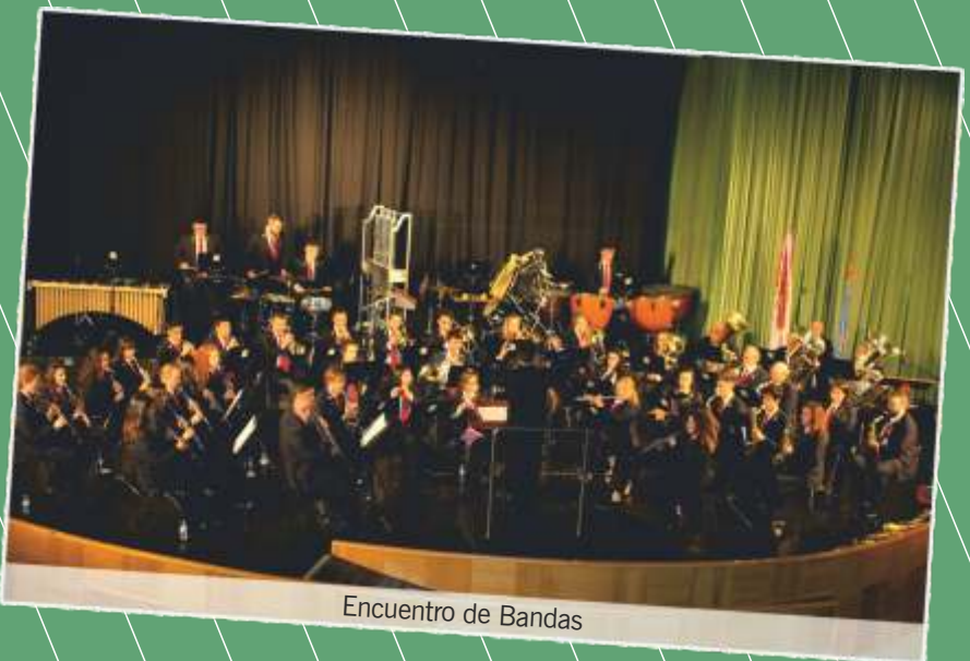
Encuentro de Bandas