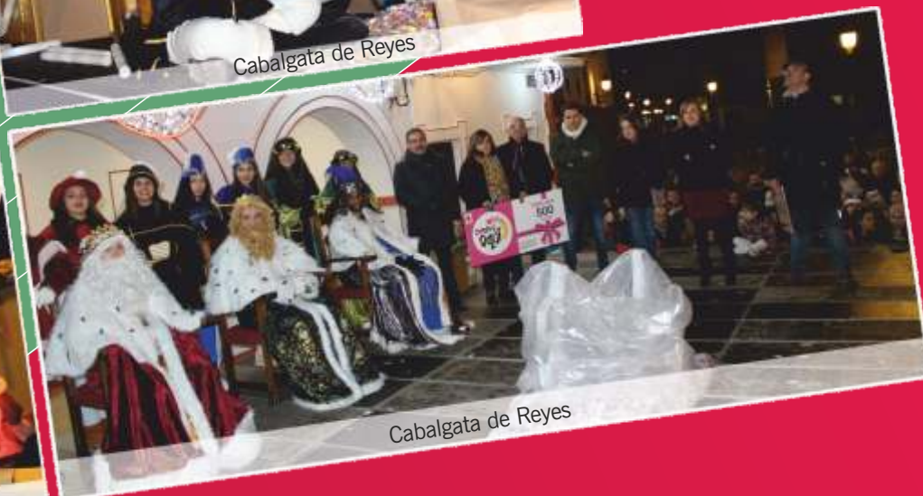
Cabalgata de Reyes