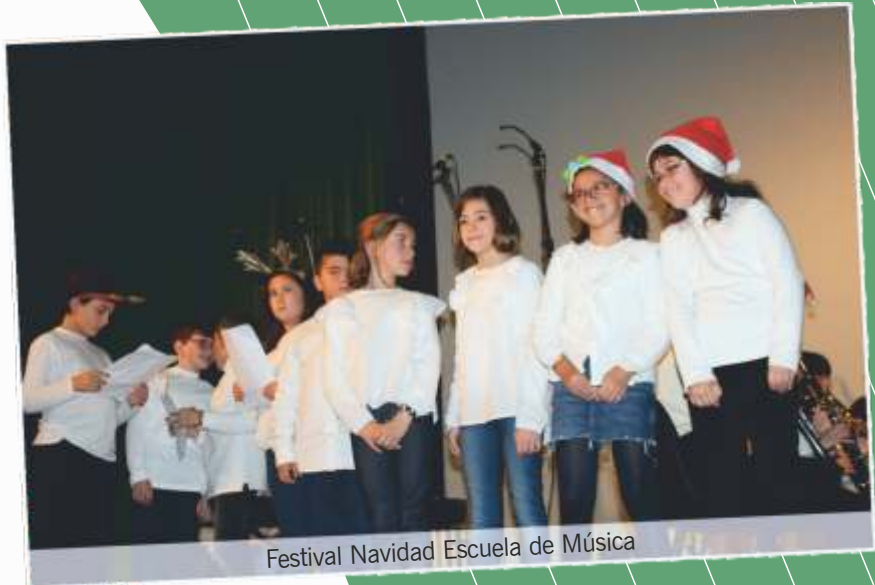
Festival Navidad Escuela de Música