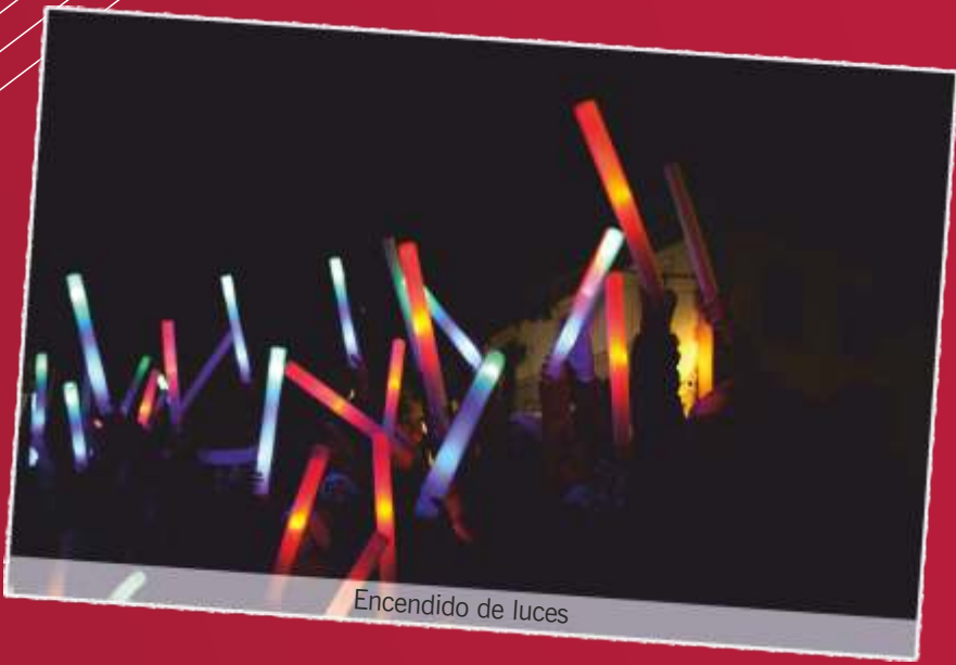
Encendido de luces