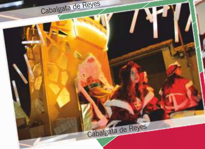
Cabalgata de Reyes