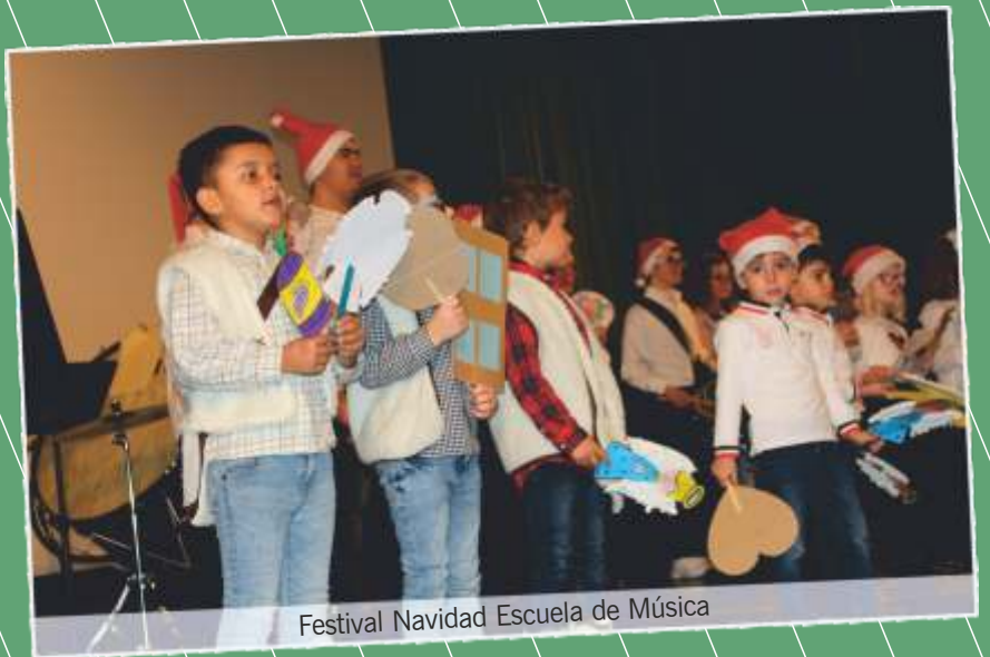
Festival Navidad Escuela de Música