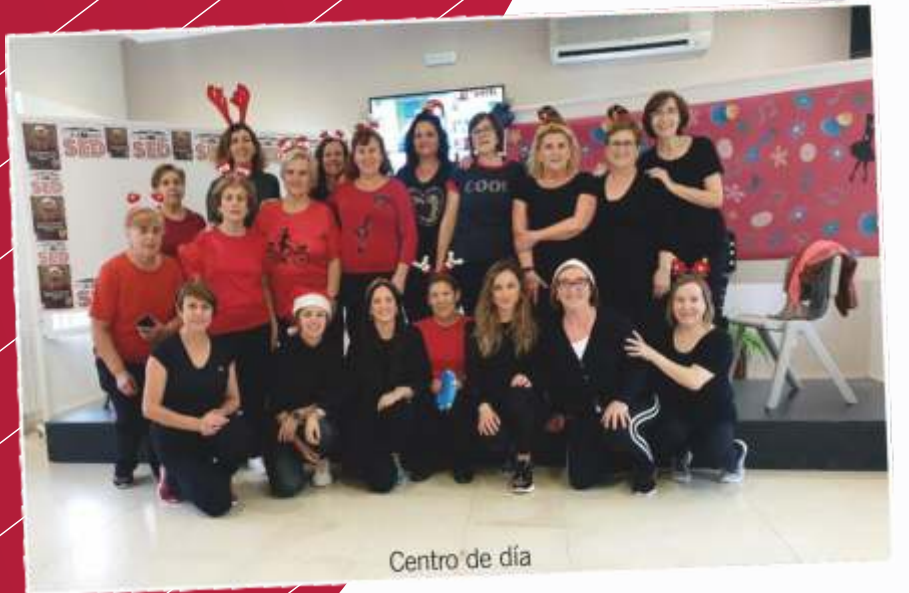
Centro de día