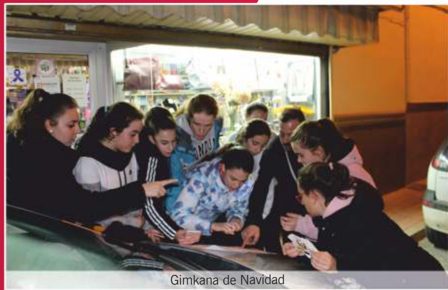
Gimkana de Navidad