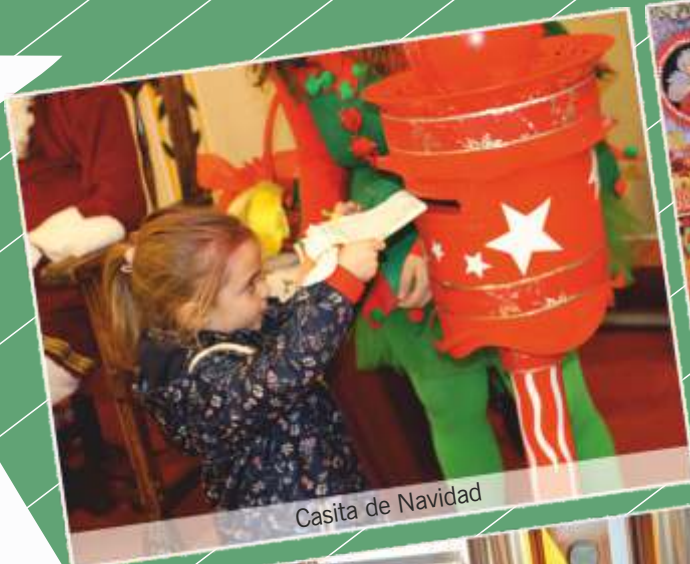
Casita de Navidad