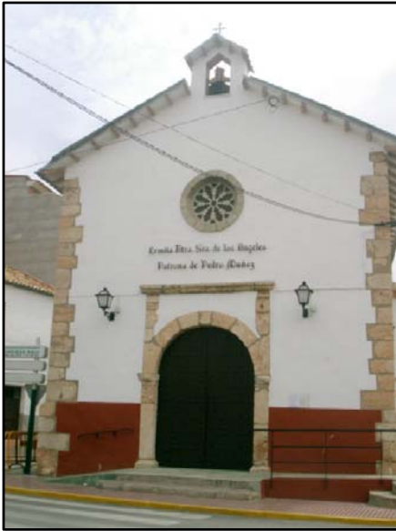
ERMITA NTRA. SRA. DE LOS ÁNGELES