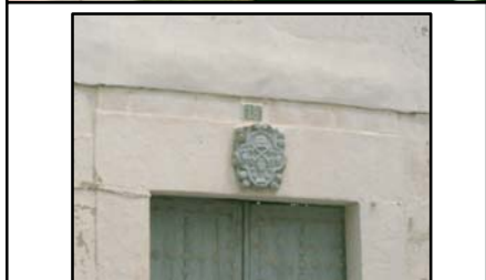
CASA SOLARIEGA C/ CAMPO N°16/18