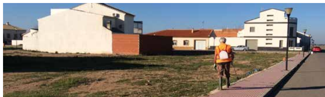
Fotografía de los trabajos de fumigación de parcelas