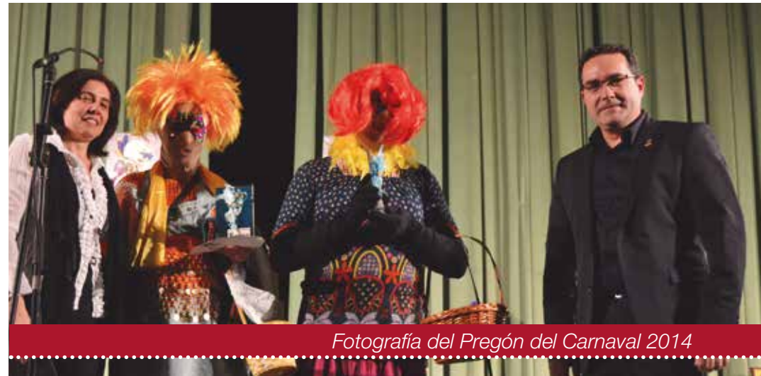
Fotografía del Pregón del Carnaval 2014