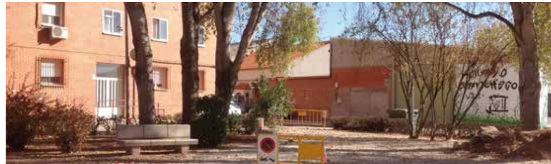
Fotografía del paraje La Vereda

Asimismo sigue la fumigación y tratamiento de las parcelas y solares sin construir para evitar la acumulación de vegetación y basuras en los mismos que tanto afean el paisaje urbano y tantas molestias crean a los vecinos colindantes.