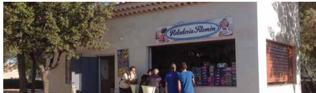
Fotografía del Parque Ecológico