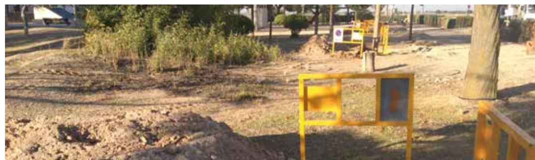
Fotografía del acondicionamiento de nuevas zonas verdes